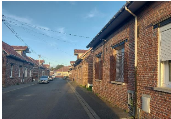
Défense pour la réhabilitation énergétique des logements de « Maisons et cités »

Vous nous avez tous dit que la ville est de plus en plus accueillante et qu'il y fait bon vivre ! Les taux de la fiscalité communale sont demeurés inchangés depuis notre élection. La rénovation de la voie ferrée, la gare, la proximité d'axes routiers importants, le BHNS sont des atouts indéniables que nous avons su protéger. L'offre de loisirs est conséquente, des entreprises s'installent, les autres perdurent et l'ensemble des actions proposées depuis la petite enfance jusqu'aux 3ème et 4ème âge participe à l'attractivité de la commune.