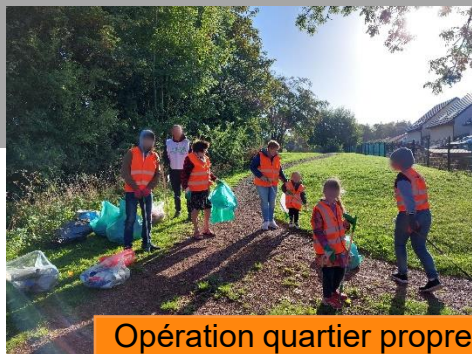
Opération quartier propre