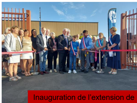
Inauguration de l'extension de l'école Deneux - 09/09/2023

Parce que le bien vivre ensemble est important notamment après cette période de pandémie, parce que l'éducation est le socle nécessaire pour que chacun ait les moyens de s'épanouir dans notre société, nous avons une politique sociale d'envergure. Celle-ci est structurée autour du pôle citoyenneté et solidarité que nous avons créé. Le Centre Culturel Isabelle Aubret en est l'épicentre. Vous y trouvez aujourd'hui l'ensemble des services à destination de la famille, le CCAS ainsi que le centre social « la maison bleue ». Cette structure développe des actions en direction des familles, des associations et en faveur des seniors.