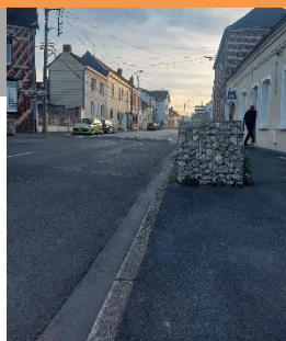
Aménagement rue Mancey