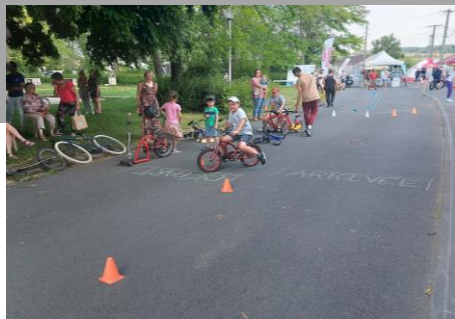
Fête de l'écomobilité à la cité 5