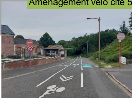
Aménagement vélo cité 5