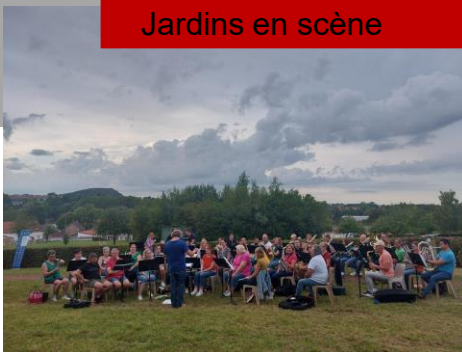
Jardins en scène